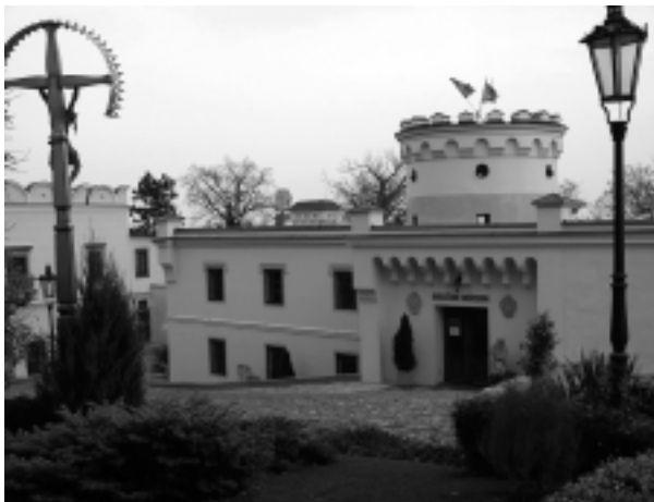
V areáli Nitrianskeho hradu nájdete diecézne múzeum, ktoré predstavuje významné cirkevné pamiatky.

Dnešné jasličky netreba dlho hľadať. Nachádzame ich na každom kroku: medzi deťmi v detských domovoch, medzi starými i opustenými ľuďmi, pod mostmi a v podchodoch, v biednych postavách prehrňajúcich sa v kontaktné