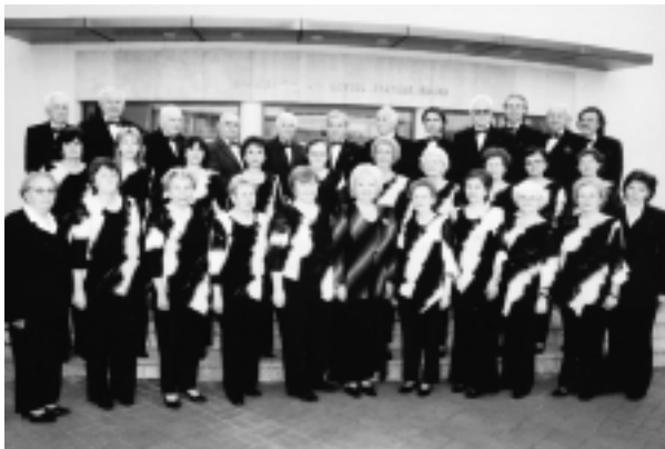
Nitriansky evanjelický spevokol vystúpil na festivale v maďarskom meste Albertirša, kde sa stretol s pozitívnu poslucháčskou odozvou.